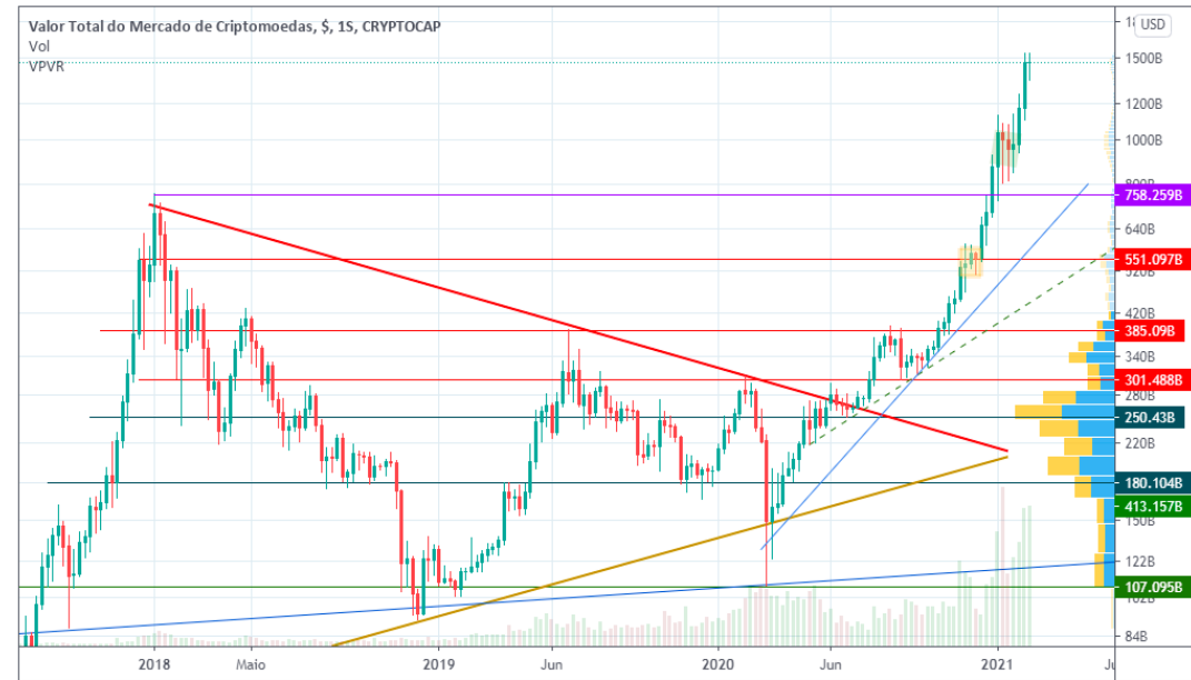
BonsaiTrades publicado no TradingView.com, Fevereiro 16, 2021 22:18:42 -03 CRYPTOCAP:TOTAL, 1W 1468.267B ▼ -2.497B (-0.17%) O: 1467.907B H: 1537.775B L: 1350.005B C: 1468.398B

Portanto esta perna de alta pode estar apenas começando e ainda pode durar mais algumas semanas antes da próxima correção significativa do mercado. Faça aportes regulares para não perder este movimento.